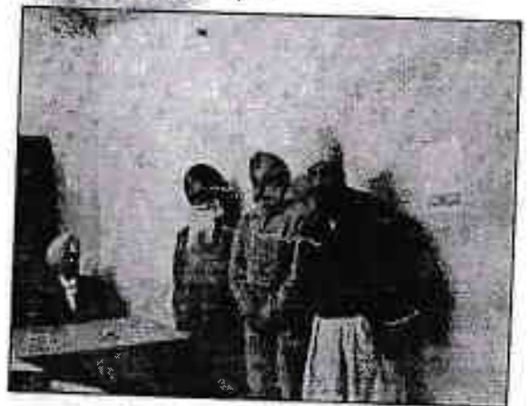
ਦੀ ਕਲਗੀਧਰ ਟ੍ਰਸਟਬਤ ਸਾਹਿਬ